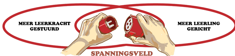
Figuur 3: Spanningsveld

nemen is, zijn leerlinggerichte onderwijsmodellen wellicht meer geschikt.